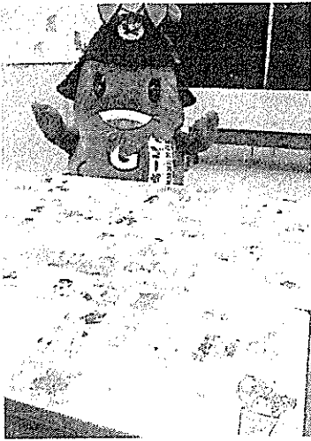
年賀状の多さに驚くゴージャ先生

カーテンのPRに努めてきた。年賀状は北海道から沖縄までの29都道府県から届いた。ゴージャ先生とちびゴージャのイラスト