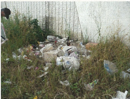
放置されたゴミの山