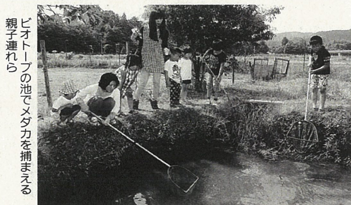
親子連れら ビオトープの池でメダカを捕まえる

三段池のビオトープで科学講座 ドジョウやスジエビなど生き物を観察 福知山市猪崎の三段池ビオトープで21日、子ども科学講座(市自然科学協力員会主催)が開かれ、親子連れらがビオトープの生き物を観察した。 三段池ビオトープは同会が02年に市動物園駐車場そばに造ったもので、広さは約400平方メートル。3つの池に小魚が生息。シヨウフやハンゲシヨウなどの植物も植えられ、昆虫のすみかにもなっている。