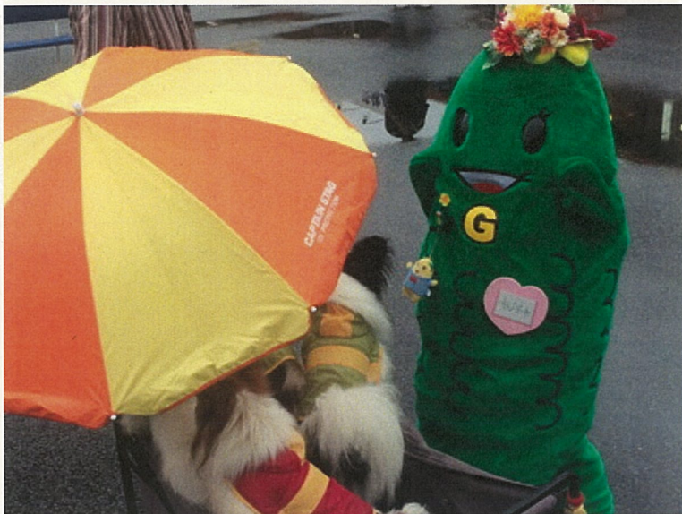
かわいいワンワンに出会って大興奮のちびゴーヤ☆