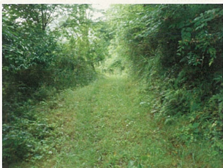
庵戸山フィールドの進入路