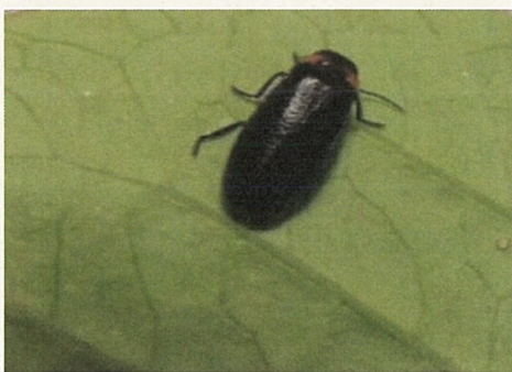
ヒメボタルの生息を確認