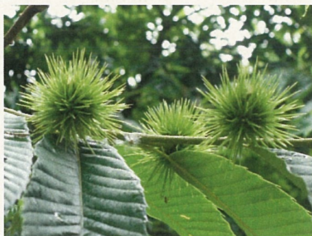
栗も元気に育っていました。