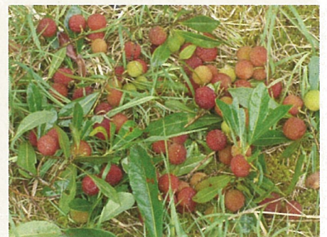
収穫したヤマモモ