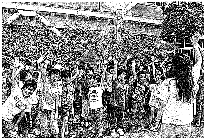
「来年もやってみたい人?」「はい!!」