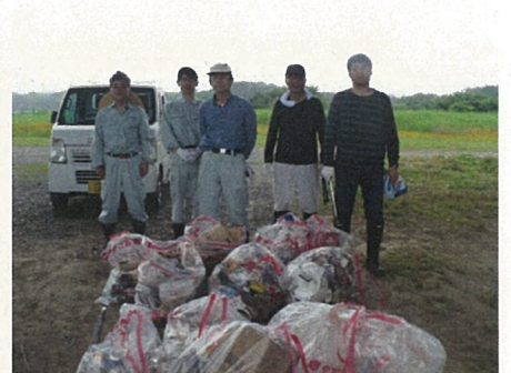
この他にも毛布が二枚