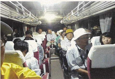
バスで山へ向かう